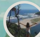
Cordillera del Sarao