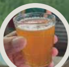
Chicha de Manzana